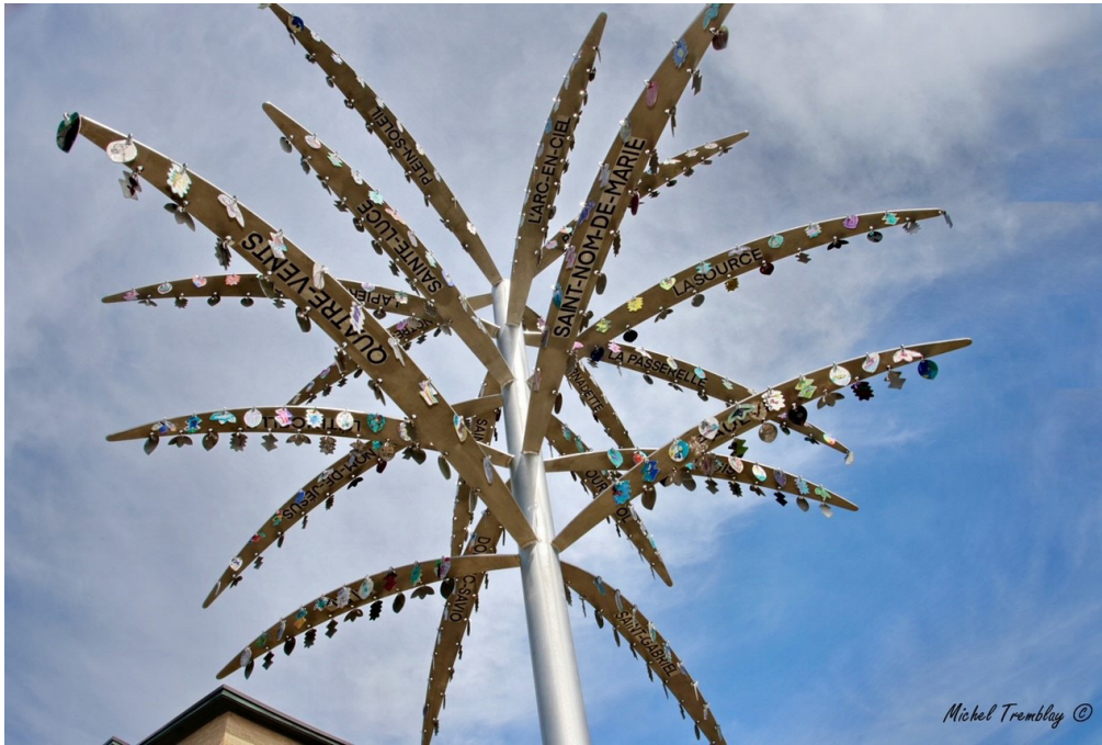
Projet d'un arbre géant dans le cadre du Jour de la Terre auquel ont participé tous les élèves du primaire. L'oeuvre est installée devant l'école St-Gabriel.