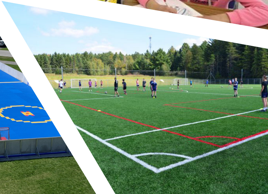
Semaine de la déficience intellectuelle à l'école de la Passerelle.